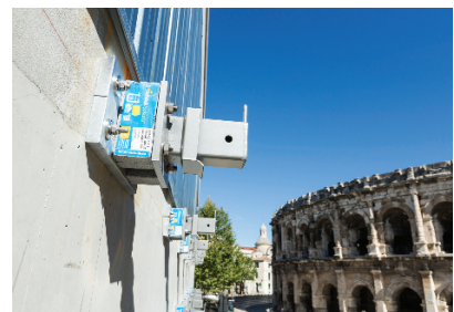
doc. Schöck / © Architecte Elizabeth de Portzamparc

le rupteur mis en place dans l'espace intermédiaire. Solution économique évitant la perte d'énergie et de chaleur, Schöck Isokorb® KST limite également les risques liés à l'humidité et la moisissure. Enfin, la facilité de pose des rupteurs qui s'adaptent aux contraintes architecturales de chaque projet se révèle un atout phare, aussi bien pour l'architecte que pour les autres acteurs du bâtiment.