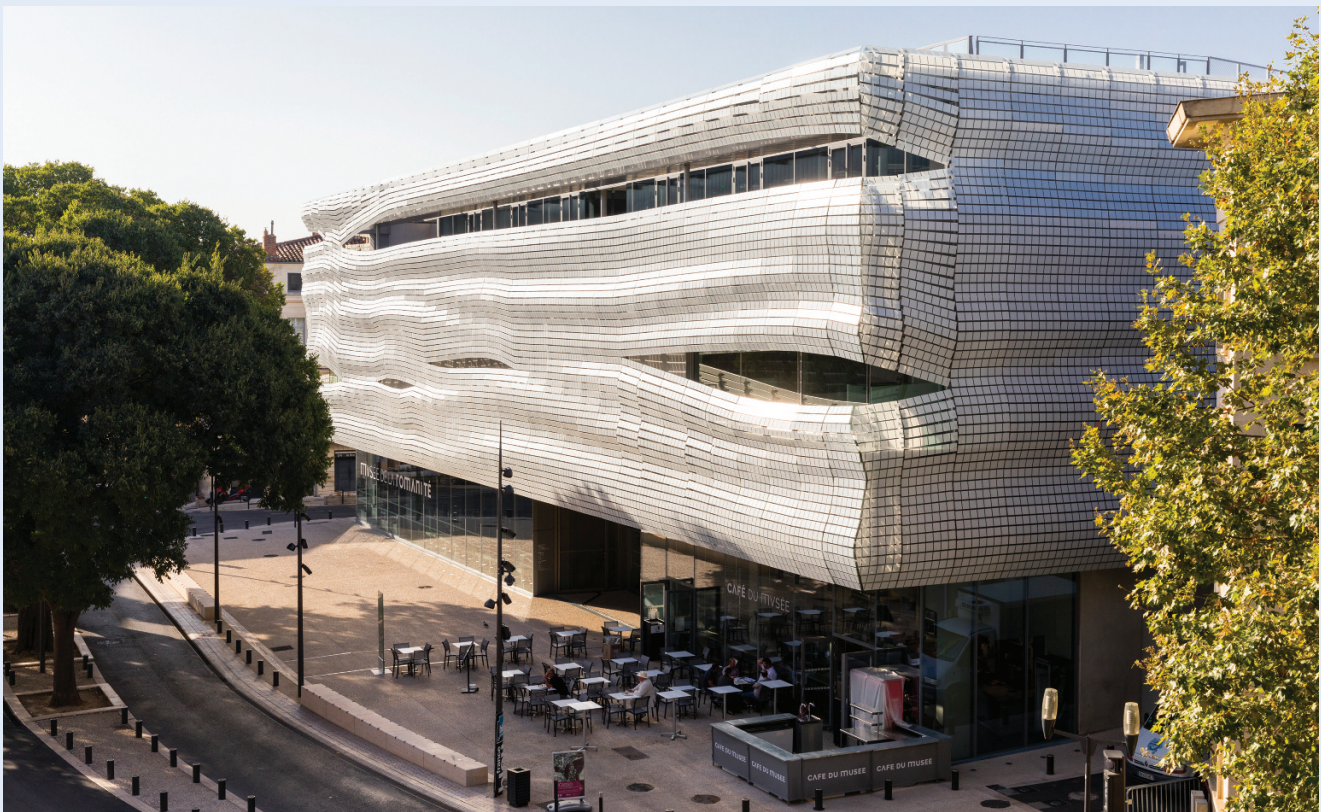
doc. Schöck / © Architecte Elizabeth de Portzamparc

Pas moins de 140 rupteurs Schöck Isokorb® ont été mis en œuvre lors de la construction du Musée de la Romanité de Nîmes (30) pour éviter les ponts thermiques entre la structure béton et la façade rapportée en verre.